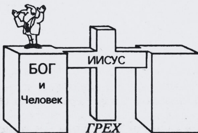
Возможность человека — принять Христа